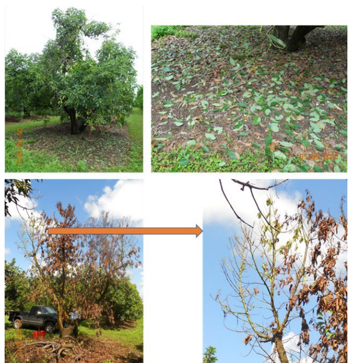
Figura 3. Árboles adultos afectados por la marchitez del laurel con secciones del árbol mostrando una defoliación grande mientras que otras secciones las hojas permanecen en las ramas antes de que ocurra la muerte regresiva y finalmente la muerte del árbol

Al contrario, las inyecciones profilácticas con Tilt® son mucho menos costosas y se ha demostrado que previenen los brotes de ML en las arboledas comerciales de aguacate. El movimiento sistémico del fungicida a través del árbol toma de siete a ocho meses, y la protección que brinda a la ML ha sido reportada en un rango de 12-14 meses, dependiendo de la tasa de fungicida, el tamaño del árbol, estado de la arboleda en el momento de infección con la ML, y la historia de la arboleda con respecto a esta enfermedad (Brooks Tropical, comunicación personal).