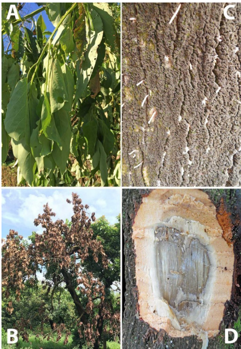
Figura 2. Los síntomas externos visibles de la marchitez del laurel comienzan por la marchitez de hojas verdes (A), típicamente en una sección de un árbol (B). Tubitos de un exudado blanquecino que se produce por la perforación de los EA pueden ser evidentes (C) la albura tiene estrías de un color negruzco-carmelitoso (D).

regresiva repetidamente hasta que el árbol finalmente muere. También se ha reportado que los tocones vuelven a desarrollar sus copas y vuelven a producir frutos después de dos a tres años. No sabemos cuán frecuentemente ocurre el reverdecimiento y la reanudación de la producción, pero este aspecto está siendo evaluado.