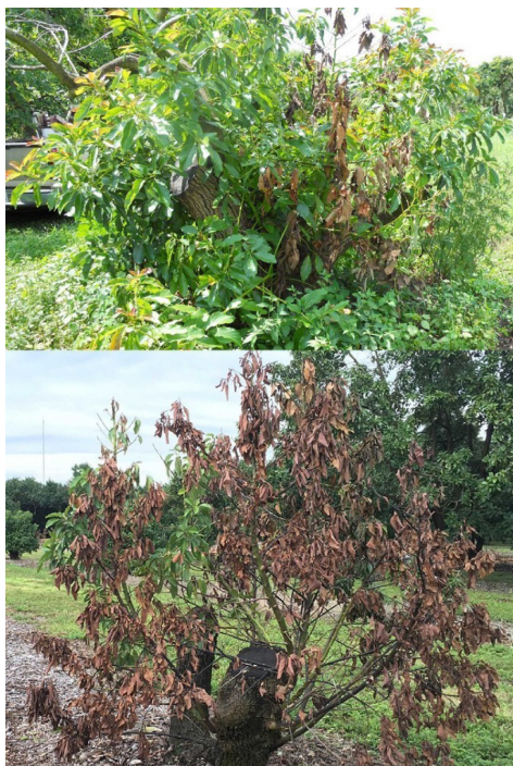
Figura 4. (A) Reverdecimiento y muerte regresiva en algunas ramas después de haber sido cortado a tocón (altura ~1.2 m), y (B) este nuevo crecimiento sufre muerte regresiva varias veces antes de que el árbol muere.

Por estas razones, los insecticidas convencionales sólo se recomiendan para suprimir las poblaciones activas de escarabajos ambrosia después de remover y convertir en serrín los árboles infestados, infectados o ambos.